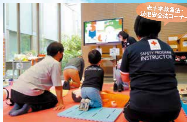
赤十字救急法・ 幼児安全法コーナー