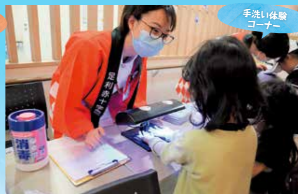
手洗い体験 コーナー