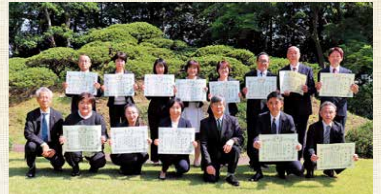
栃木県公館に於いて(勤続30年)

本年度は勤続30年が16名、勤続20年が9名、勤続10年が44名の計69名の職員が表彰されました。