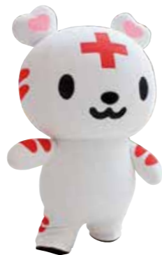
当日応援に駆けつけてくれた ハートラちゃん