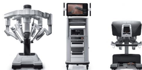
手術支援ロボット da Vinci Xi